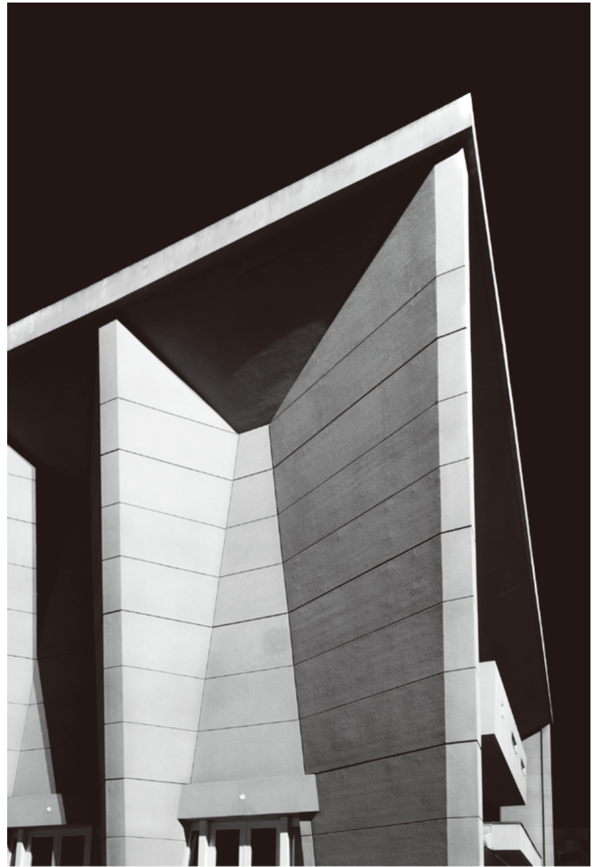
今治市公会堂